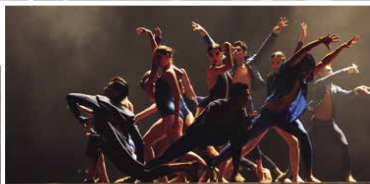
● Scenes di "Leonardo e il suo tempo", "viaggio in Italia" con l'Orchestra da Camera di Curitiba l'auditorium Santa Maria e del "Gala Bolshoi" nel Teatro Guaíra. ♦ Cenas de "Leonardo e il suo tempo", "viaggio in Italia" com a Orquestra de Câmara de Curitiba o auditório Santa Maria e do "Gala Bolshoi" no Teatro Guaíra.

U na grande, divertente ad applaudita festa della cultura italiana. Così è stata l'edizione 2019 del "Mia Cara 2019". Realizzato dall'Ambasciata d'Italia e dal Consolato d'Italia per il Paraná e