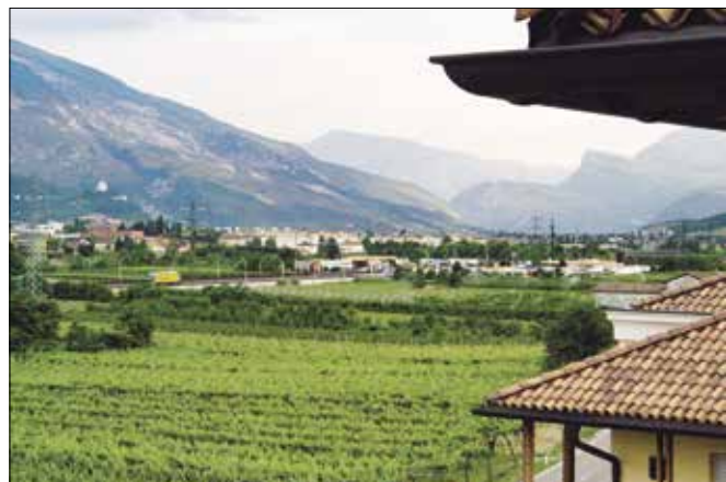
● Resti della romana Tridentum (spazio archeologico sotterraneo del Sas) ed un paesaggio tipicamente trentino. ◆ Vestígios da romana Tridentum (espaço arqueológico subterrâneo do Sas) e uma paisagem tipicamente trentina.

tríaco. Chegando nesse ponto, a História nos faz tirar a seguinte conclusão: Os imigrantes trentinos são de origem latina, que falavam o italiano, morando na região fundada pelos romanos. Portanto, não são tiroleses, na aceção da palavra. É evidente que, como vimos, os fatos históricos nos impõem que houve influências "ladinas" e, principalmente, alemães, em tudo, inclusive pelas migrações internas e pela miscigenação, como, possivelmente