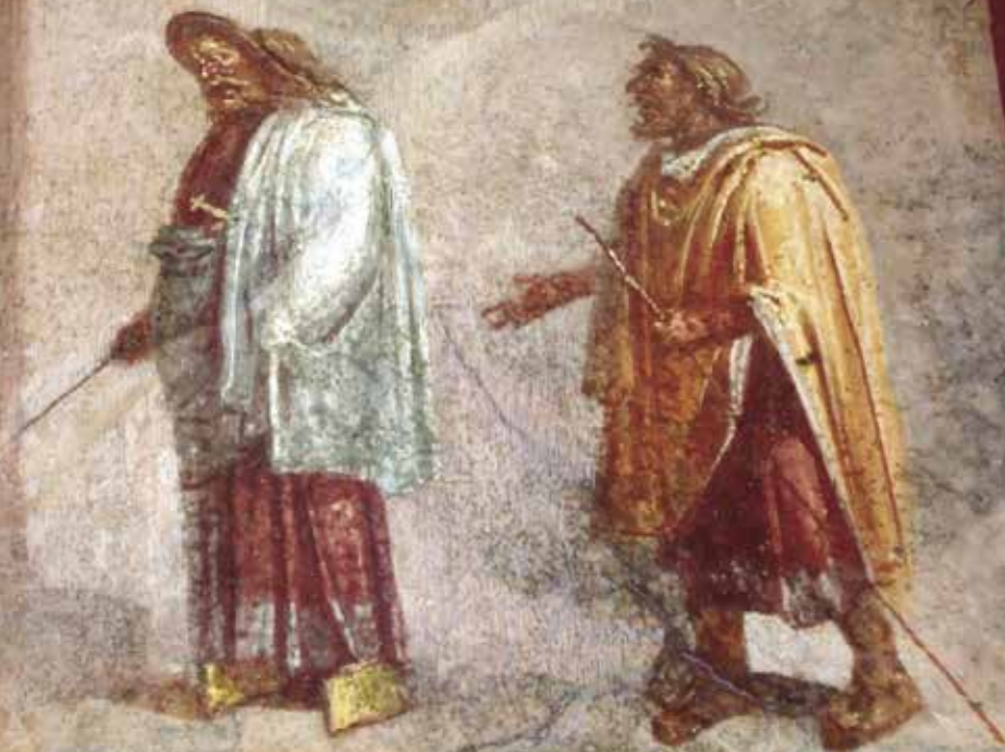
● Scena teatrale ( Affresco romano, Palermo, museo archeologico ). ♦ Cena teatral (Afresco romano, Palemo, Museu arqueológico).